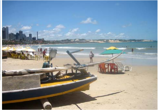
Strandliv så långt ögat nådde...

Området är trivsamt med en del äldre, mindre hotell nere vid stranden tillsammans med restauranger, uteserveringar och butiker. Här tillbringade vi en heldag med att strosa runt, bada, titta på folk och leva turistliv. Överallt sålde man smårätter, solskydd, kläder och souvenirer direkt på stranden.