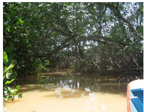
I kanot bland mangrove

Här gjorde vi en dag en båtutflykt som övergick till kanottur i smala kanaler bland mangroven.