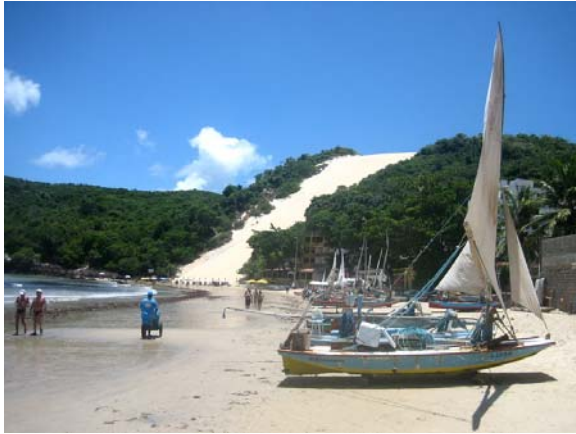
Morro do Careca, såg ut som en slalombacke

Vi åkte till den södra delen av staden, till Natal's mest kända strand, Praia Ponta Negra, som är flera kilometer lång. I södra änden av stranden ligger Morro do Careca, en 120 meter hög sanddyn. Tyvärr har erosionen gjort den instabil så det är inte längre tillåtet att klättra upp på dynen.