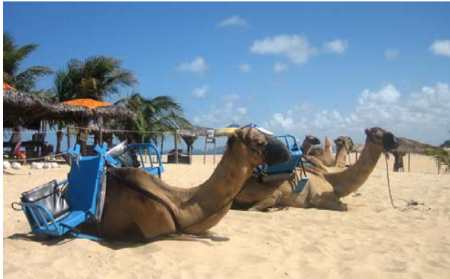
Man kunde rida kamel...

Visst var dynerna fina, men som strand tyckte vi Ponta Negra var klart överlägsen denna.