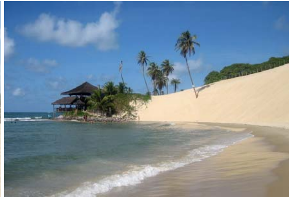
... eller besöka läckra Bar & Restaurang 21!

Dagens mest brasilianska händelse blev istället färden till Genipabu. Vi gick över till playan bortanför yachtklubben, där bron går över till nordsidan. Först besökte vi busstorget som skickade oss vidare längs stranden. Plötsligt stannade buss nr 48, som vi vet går in till centrum, och erbjöd sig att skjutsa oss till rätt buss! Hela bussen engagerade sig för att få oss att förstå att det var klokt att åka med dem söderut, alltså åt fel håll, så till slut klev vi på och blev avsläppta i en annan del av staden med beskedet att "här passerar bussen till Genipabu"! Mycket riktigt. Efter lång väntan så dök vår buss upp.