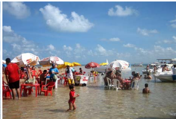
Här stod både barer och bord ute i vattnet