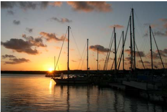
Solnedgång över vår brygga i Jacaré

Så fort vi var tillbaka från vårt äventyr i Amazonas djungler startade arbetet med att förbereda vår långa segling norrut. Bland annat behövde botten göras ren efter dessa veckor som båten legat i en flod. Inte något man drömmer om när sikten bara är 10-20 cm. Marinan fixade det åt oss. För motsvarande 500 SEK dök en kille, med tuber, och både skrapade och tvättade hela vår botten som nu blev jättefin. Gasol fylldes, enkelt denna gång. Bara att lämna vår svenska flaska till en av ägarna till marinan så fick vi tillbaka den fylld lite senare samma dag. Bunkra, tvätta, fylla vatten, sjöstuva, ja listan kan göras lång men vi har hunnit göra båten klar för avfärd några gånger nu så båda vet vi vad som skall göras.