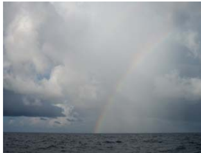
Sqalls, med efterföljande regnbåge