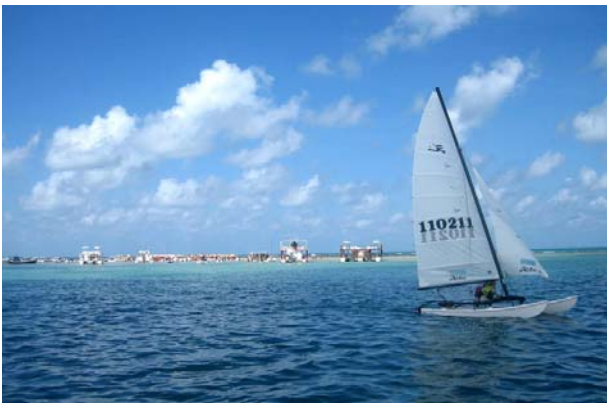
Areia Vermelha, med fullt av båtar ankrade framför

En lördag passade vi på att göra det som brasilianarna här gör, nämligen att åka med en båt ut till Areia Vermelha. Det vill säga "den röda sandens ö". Denna finns bara under några timmar, vid lågvatten, ca 25 dagar per månad. Då ställer man ut barer och folk sitter i vattnet och njuter eller badar och snorklar. Det är också hit man passar på att åka med sin motorbåt. När vattnet stiger töms ön och blir återigen en del av revet som ligger utanför Cabedelo.