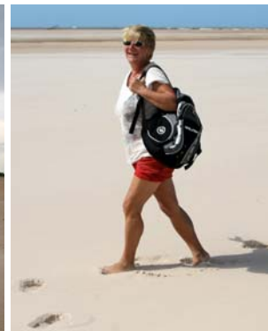
Med sand mellan tårna...

Den kvällen tog vi en taxi hem till Luis Correia. Vår taxichaufför, som hade 33 år bakom ratten, var som en uppslagsbok och hela färden blev som en guidad tur. På långsam, tydlig portugisiska beskrev han vad som gjorts i staden, vad olika byggnader rymde och vad vi borde kika lite närmare på. Samtidigt berättade han om sin familj och de sex barnen, en var taxichaufför som pappa medan en annan var professor. En helt underbar människa som var stolt över sin hemtrakt!