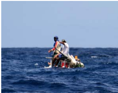
Liten brasiliansk fiskebåt

myndighetspersoner som älskar att stämpla papper och gärna skickar runt folk i timalt innan allt är klart. Vi började diskutera hur det fungerar i Sverige. Om scenariot är en icke europeisk båt som besöker Sverige. Hur fungerar det med immigration, uppehållstillstånd och liknande? Vi tror att det finns internationella regler för detta och man skall komma ihåg att de flesta länders invandring inte sker från segelbåtar i gästhamnen så immigrationsmyndigheten ligger förmodligen på något lämpligare ställe än i hamnen. Sedan skall båten klareras in i landet och där hamnar man troligen under samma regelverk som ett stort transportfartyg, därav formaliteterna och kraven på vårdad klädsel. Kaptenen för transportfartyget bär ju uniform. Frisk besättning, inget smuggelgods ombord, nästa destination och liknande uppgifter är desamma oavsett fartygets storlek. Vi har alltid blivit korrekt bemötta, alla utom en portugisisk tullare har varit trevliga och tillsammans har vi krånglat oss igenom alla papper trots språkhinder. Något vi är glada för är att vår båt är registrerad hos Sjöfartverket. Det första som frågas efter är skeppspapper och vårt officiella papper med fina stämplor på går alltid hem. Kopia på båtförsäkringen är också populärt om man kan lämna, men det är mest hamnkontoren som uppskattar.