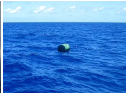
Möte! Vi såg 4, tur det inte var natt

16 mars var vi klara för avgång då vår italienske båtgranne, som lämnat Natal några timmar tidigare, kom tillbaka utifrån och åter ankrade bredvid oss. Vi frågade förstas varför och han berättade att sjön bröt över båten så att han inte vågade fortsätta. Därför blev även vi kvar en dag extra men sedan bar det av norröver. Brasiliens nordkust är långgrund och här är gott om små fiskebåtar så vi gick långt ut från land. Dessa fiskebåtar har ingen navigations- eller kommunikationsutrustning och när de blir trötta så lägger de sig och sover, utan lanternor! Upp till 50 distans ut från land. En amerikansk seglare vi mötte hade längre norrut seglat på en, tack och lov utan skador på besättningar och båtar. Kraftig medström får man också så efter bara 3,5 dygn var vi framme i Luis Correia efter att ha seglat 365 Nm men förflyttat oss 515 Nm. Mycket tacksamt!