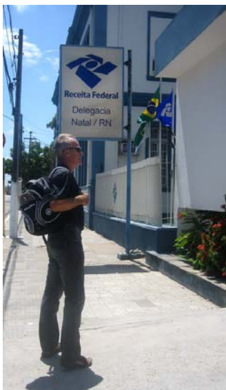
Med långbyxor på...

Återigen slår det oss vilken språkförståelse man utvecklar på en resa som den vi gör. När man byter land, och därmed språk lite då och då, upptäcker man snart likheterna mellan de olika språken. Vi kan bara lite spanska och absolut ingen portugisiska men man lär sig snart att använda lite spanska, lite franska, lite engelska och lägga till lite portugisiskt uttal. När orden tryter tar man till händerna och svenskan, vilket brukar fungera utmärkt. Det är nämligen få som pratar engelska här.